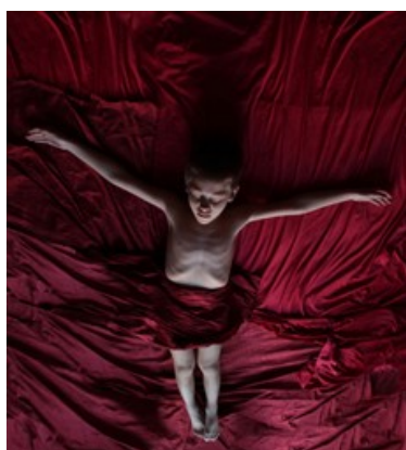
Ελένη Λύρα, φωτογραφία 1,60 X 1,75μ. 2011

Σημείο αναφοράς στο έργο της Ελένης Λύρα αποτελεί η σκηνοθετημένη και ψηφιακά επεξεργασμένη φωτογραφία διαμέσου της οποίας δημιουργεί ανθρωποκεντρικά εικονικά περιβάλλοντα που πραγματεύονται τόσο το ζήτημα της εικόνας όσο και του χώρου. Η καλλιτέχνης επιχειρεί να εκφράσει μια μεταφυσική αισθητική, η οποία δανείζεται στοιχεία άλλοτε από την ανατολική αισθητική και τη βυζαντινή τέχνη, και άλλοτε από την αναγεννησιακή και μπαρόκ εικονογραφία, χρησιμοποιώντας τα νέα ψηφιακά μέσα και τη φωτογραφία για να δημιουργήσει μια σειρά από ψηφιακά φρέσκο. Αυτού του είδους η τέχνη θα μπορούσε να χαρακτηριστεί ως μια ψηφιακή τοιχογραφία όπου τις ψηφίδες αντικαθιστούν τα pixels της virtual εικονογραφίας εφόσον προσεγγίζει παραδοσιακές φόρμες και αρχέτυπα διαμέσου μιας απολύτως σύγχρονης μεθοδολογίας.