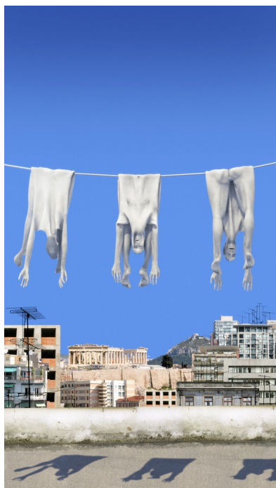
Μπάμπης Βενετόπουλος, the Laundry, 2011, 3d animation, Full HD video, 2'40'' loop

Τα 4 έργα μετατρέπονται στο χώρο 18 σε ένα ενιαίο περιβάλλον. Εξερευνούν τις πολλαπλές εικόνες που συγκροτούν την κοινωνική ταυτότητα του εαυτού και χωρίς εικονογραφικές συμβάσεις απομονώνουν στοιχεία και σημασιοδοτούν νέες αντιλήψεις ως προς το χώρο και τα υλικά.